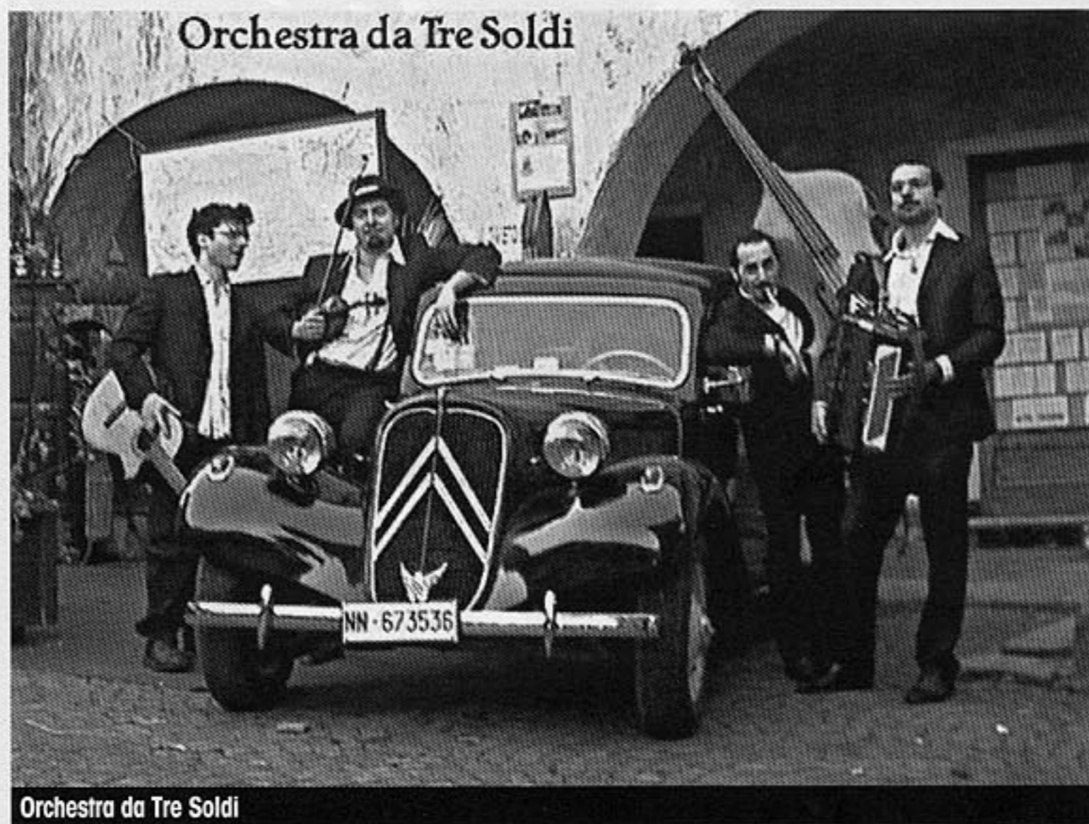
Orchestra da Tre Soldi

L'album è una cartolina da altrove, un mosaico in quattordici pezzi recuperati in tempi e posti differenti, ciascuno un'immagine e una storia che arriva da un luogo distante che però messe insieme acquistano a sorpresa un senso forte e chiaro, coesione e personalità. Per andarci vicini a parole bisogna usare i superlativi e spingere forte. L'of-