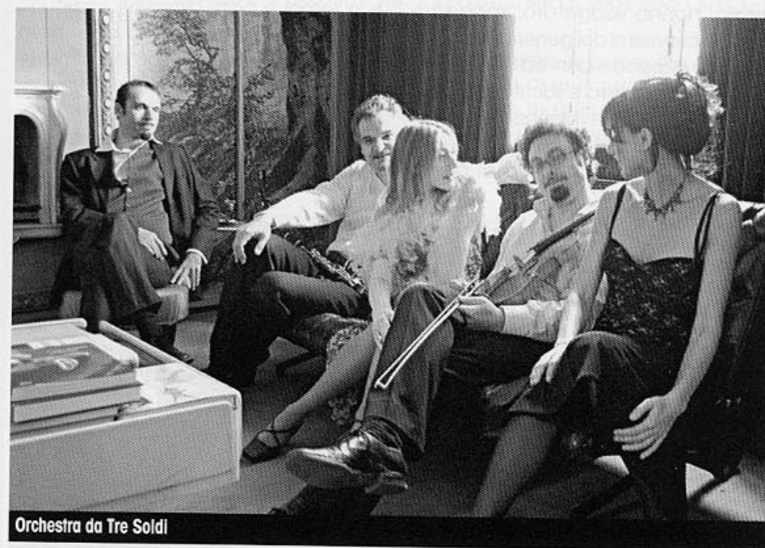
Orchestra da Tre Soldi