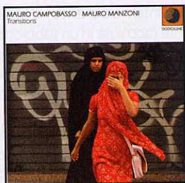
MAURO CAMPOBASSO / MAURO MANZONI. TRANSITIONS. CD dodicilune dischi Ed235. (73:29). DDD. Stereo. Lecce, 2007 www.ird.it